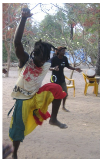
Cía Fôret Sacréé